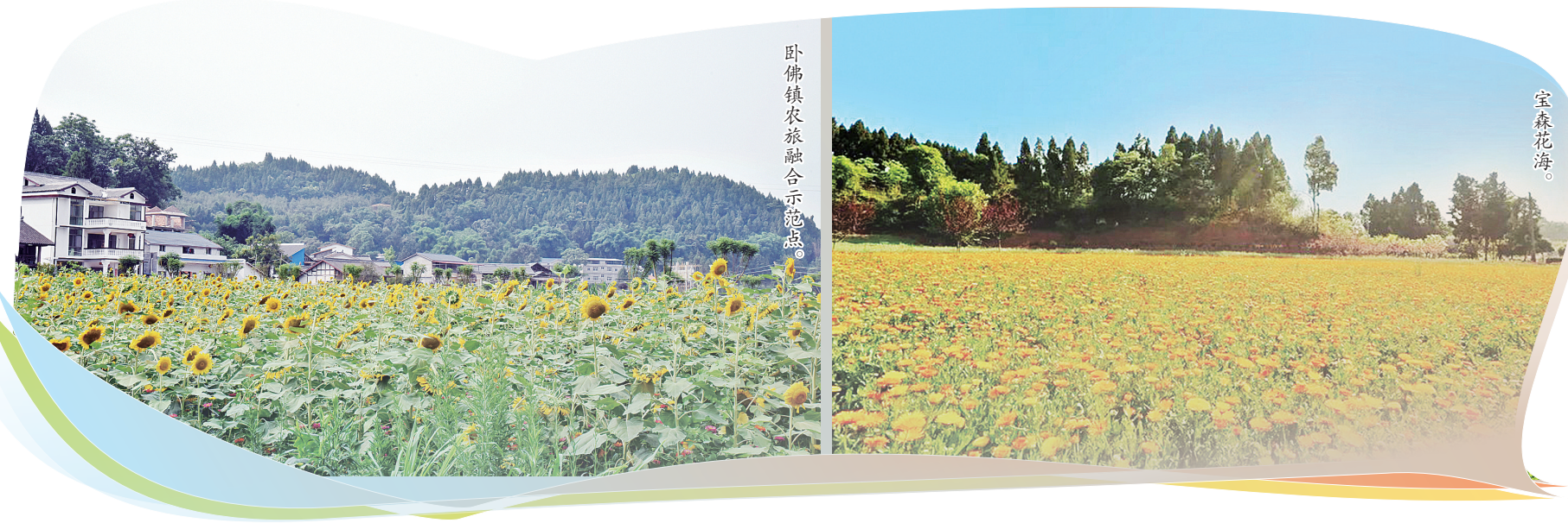
卧佛镇农旅融合示范点。