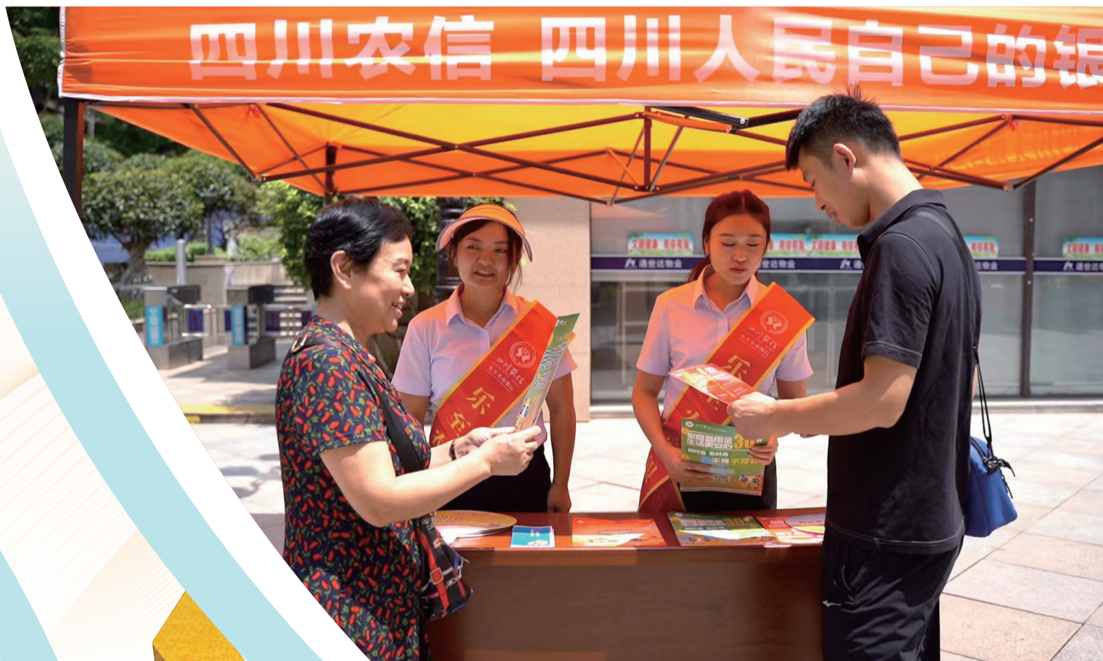
“乡村振兴·普惠到家”全员大走访专项活动。