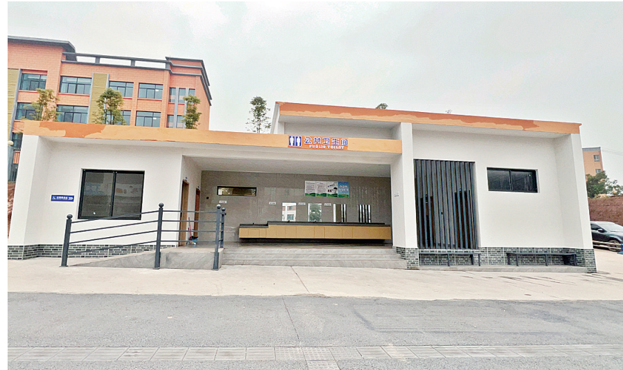
安岳县岳石小学附近的公共厕所。

管护方面,保洁员每天7:00-22:00在岗负责保洁,环卫所管理人员则每日巡回检查,确保设施完好、环境整洁。“这个公厕周边有学校,使用频率较高,我们安排的是定人定岗,保洁员只负责这里,不兼