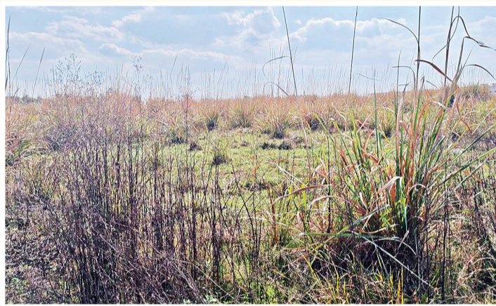
宝台镇白沙村19亩工业用地改造前后对比