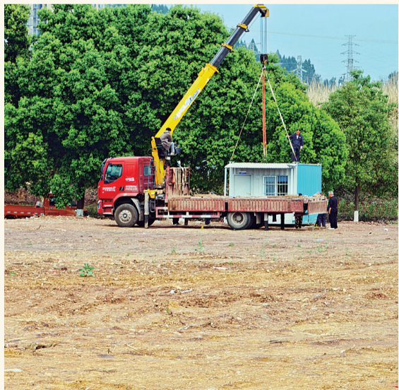
项目改造施工现场。

这不是一次简单的资产交易，而是一场着眼长远的空间布局。通过国企先行介入、政府主动掌控，将陷入历史纠葛的存量土地，从被动处置转为主动掌控，为后续优质项目的引入预留了承载空间。沉睡十年的土地，由此踏上重生之路。